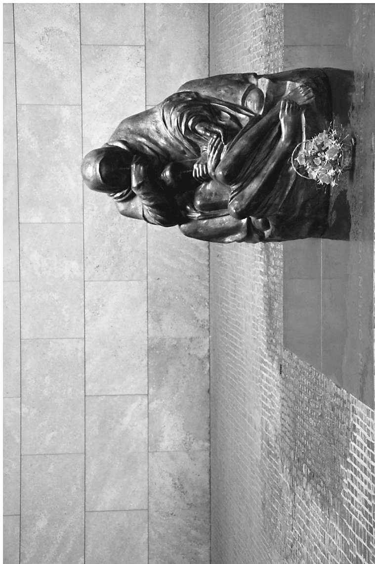
Fotografía: Xavier Luján, 2011.