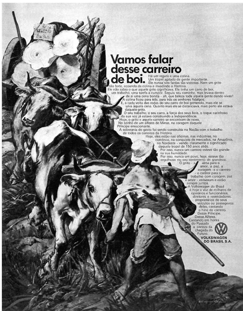
Imagem II. Propaganda de Volkswagen. Revista O Cruzeiro , 13 de septiembre de 1972, p. 83.