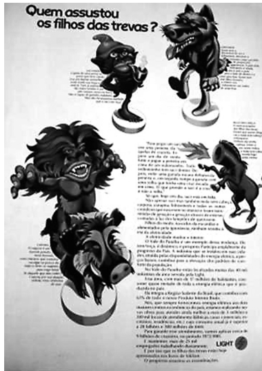
Imagen III. «¿Quién asustó a los hijos de las tinieblas?». Revista O Cruzeiro , 13 de septiembre de 1972, p. 91

La Light —empresa de suministro de energía eléctrica— trabajó con las narrativas culturales existentes en diferentes regiones del país. La publicidad titulada «¿Quién asustó a los hijos de las tinieblas?» se hizo tomando como base las caricaturas de Sací Pereré, del hombre lobo, de Curupira y de la mula sin cabeza, con notas explicativas de la función de cada uno. La pieza publicitaria no descarta el uso de texto explicativo. Comienza narrando una supuesta estrategia para capturar un Sací 23 y, a continuación, remite al lector a los tiempos actuales, registrando: