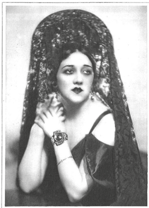
FIGURAS FEMENINAS DE LA ESCENA MARÍA FERNANDA LADRÓN DE GUEVARA